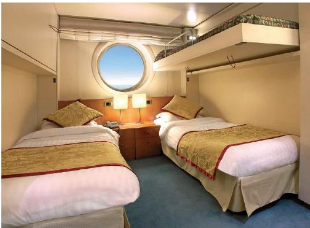
ห้องพักแบบมีหน้าต่าง (OCEAN VIEW CABIN)