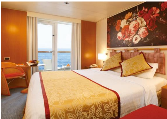
ห้องพักแบบมีระเบียง (BALCONY CABIN)